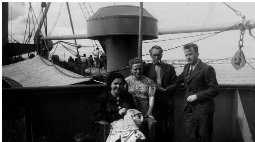
Arribada del De la Salle a Ciudad Trujillo (ara Santo Domingo), amb la nena nascuda a bord, el desembre de 1939.