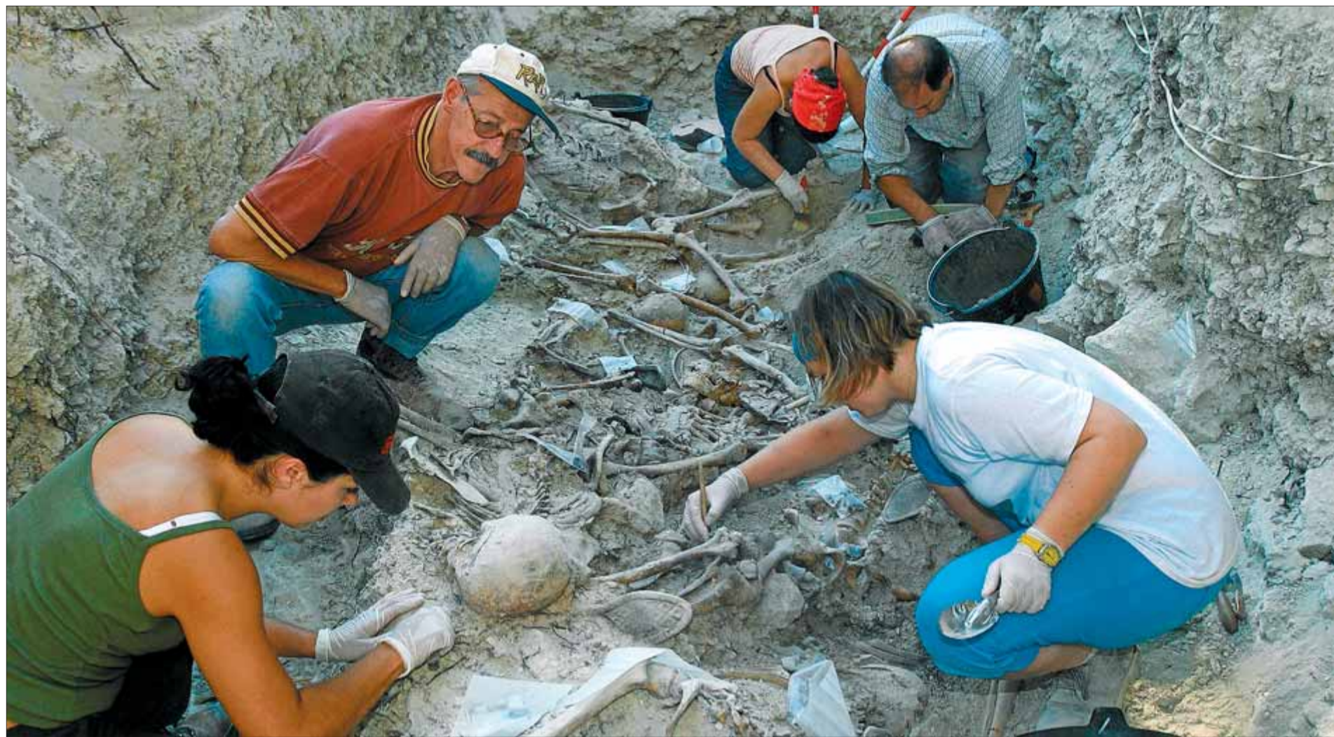
Un grup d'arqueòlegs treballant en una fossa de la Guerra Civil al municipi palentí de Baltanas